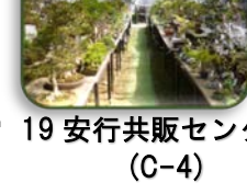
19 安行共販センター (C-4)