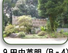
9 田中英明 (B-4)