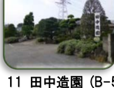
11 田中造園 (B-5)