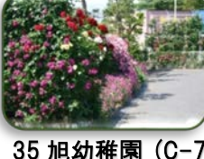
35 旭幼稚園 (C-7)