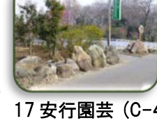
17 安行園芸 (C-4)