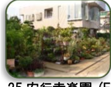
25 安行幸楽園 (E-4)