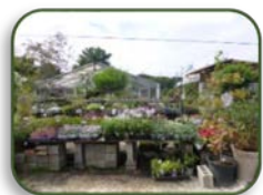
4 安行植木売店 (B-2)