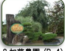
8 加藤農園 (B-4)