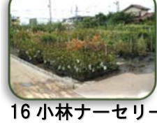
16 小林ナーセリー (B-4)