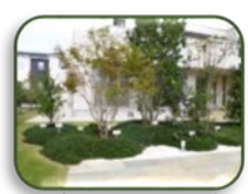
2 安行緑化仲徳園 (C-2)

11日12日 AM 11:00~PM 2:00 地元中学生による野だて(無料)開催 雨天中止