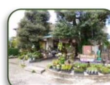
30 桜木園 (D-7)