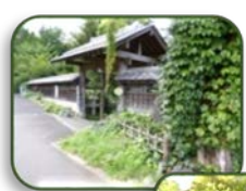
3 好樹園 (B-2)

11日12日 AM 11:00~PM 2:00 地元中学生による野だて(無料)開催 雨天中止