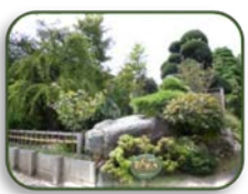
1 大起園 (C-2)