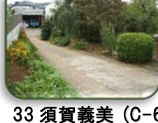
33 須賀義美 (C-6)