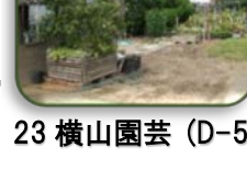
23 横山園芸 (D-5)