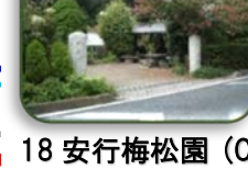
18 安行梅松園 (C-4)