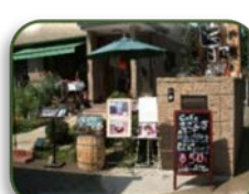
15 café さざんか (C-4)