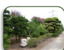
26 松山苑 (D-6)