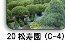
20 松寿園 (C-4)