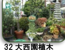
32 大西園植木 (D-9)