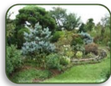
7 田中邸 (A-3)

11日12日 AM 11:00~PM 2:00 自家製窯焼ピザ、コーヒーなど (有料)