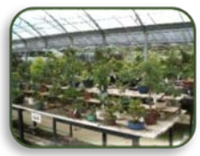
6 小雅盆栽センター (C-3)