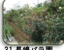
31 長嶋バラ園 (D-8)