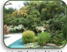
14 長島邸 (C-3)