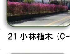
21 小林植木 (C-5)