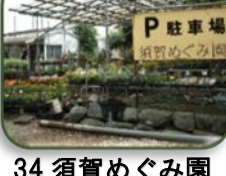
34 須賀めぐみ園 (C-6)