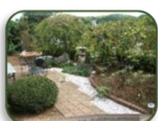
5 岡本邸 (A-2)

11日12日 AM 11:00~PM 2:00 自家製窯焼ピザ、コーヒーなど (有料)