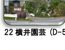
22 横井園芸 (D-5)