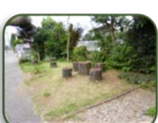
28 鈴木邸 (D-7)