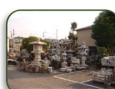
24 山樹 (D-5)