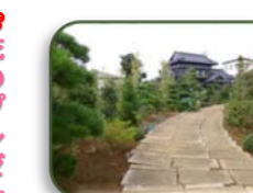
29 坂口植物園 (D-7)