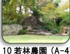
10 若林農園 (A-4)